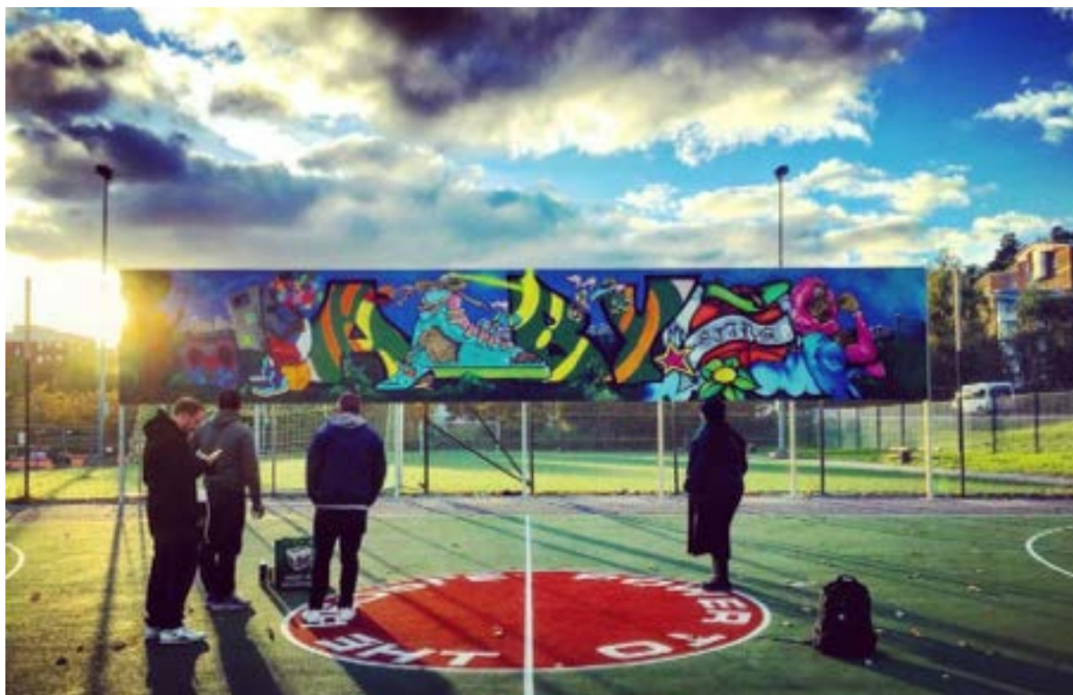
Unga konstnärer sätter färg på Alby