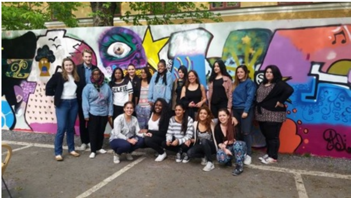
Kulturjägarna, omgång 2. 2015

Vi vet att konst och kultur kan förändra Botkyrka och världen och vi tror att Du kan göra det tillsammans med oss!