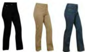
10 Svart 33 Khaki 29 Denim