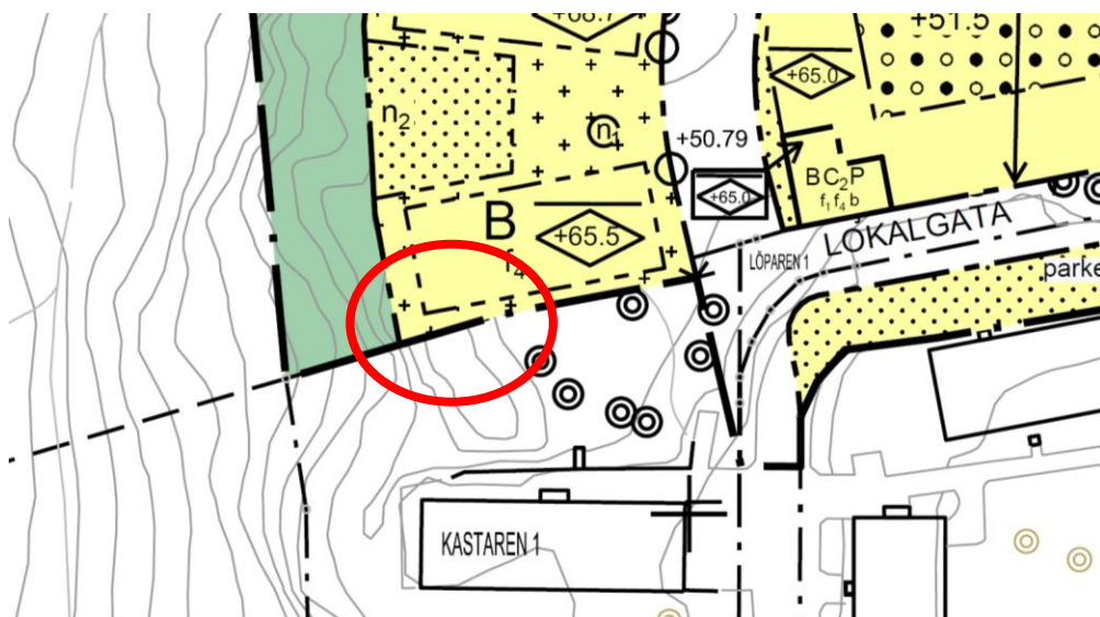
Plankartan från granskning mellan den 10 november och den 1 december 2017. Den smala kilen av naturmark ersätts av kvartersmark.