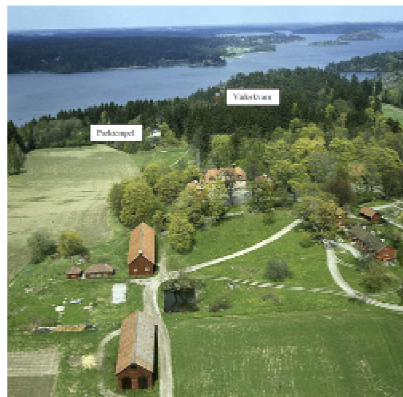
Flygfoto över Hallunda gård.