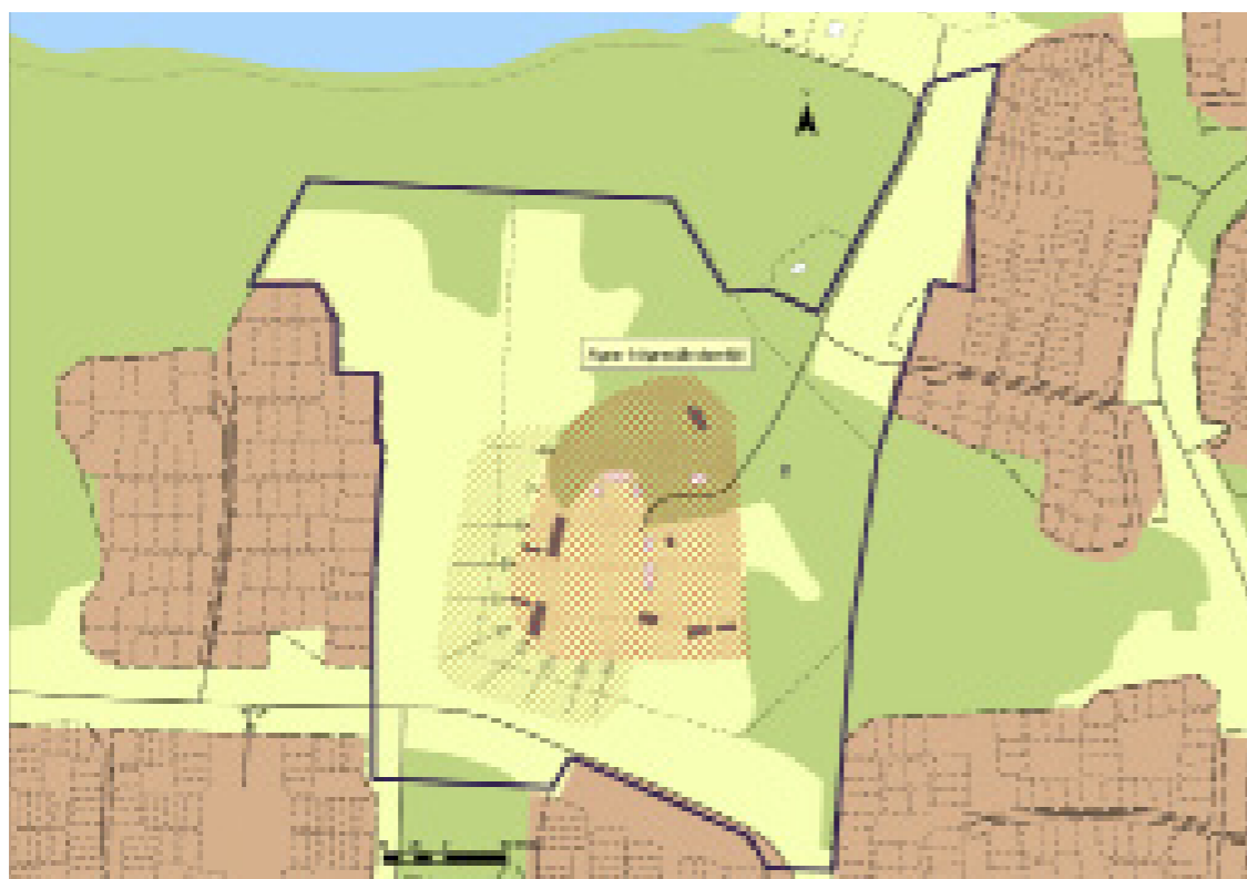
Rekommenderade vyer att behålla /undvika exploatering på (skrafferad yta söder och sydväst om Hallunda gård). Karta och rekommendation från utredning i ref.lista (Pia Nilsson)