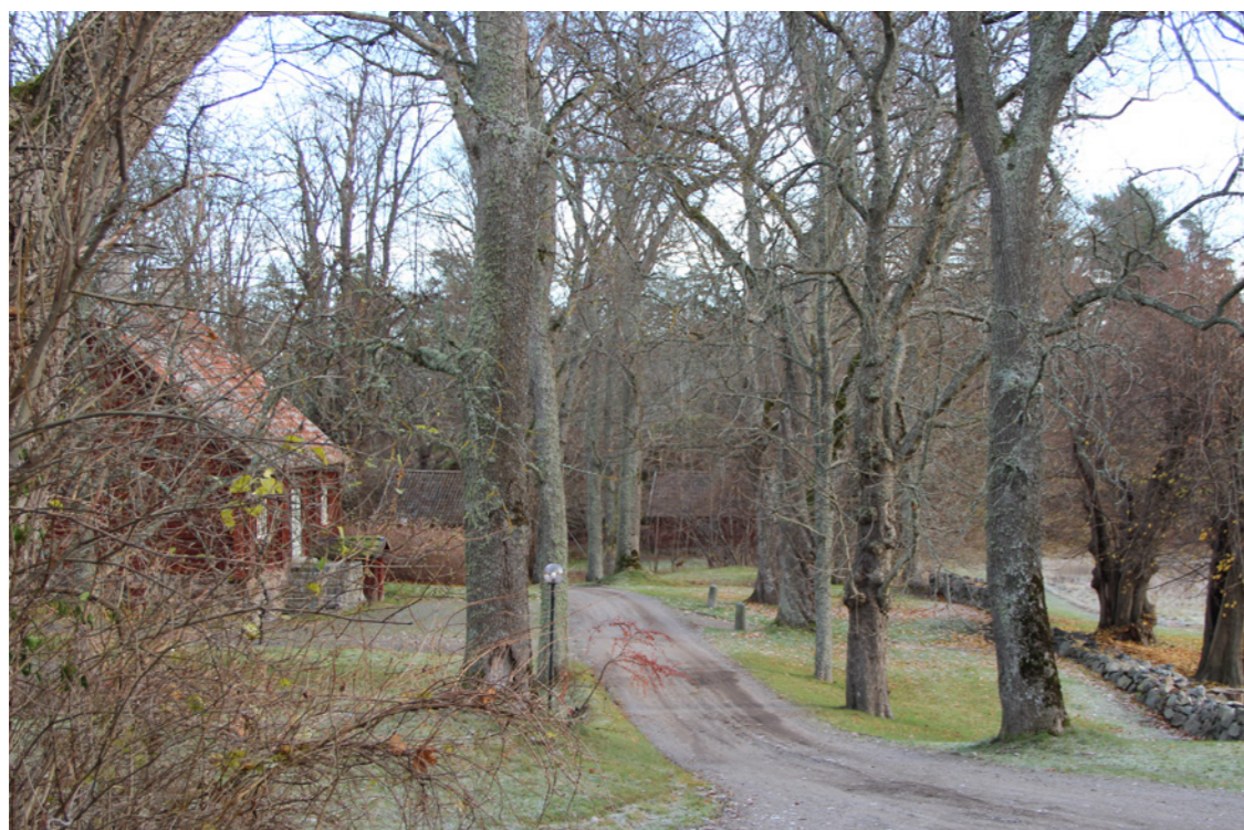
Vy från Hallunda gård mot planområdet