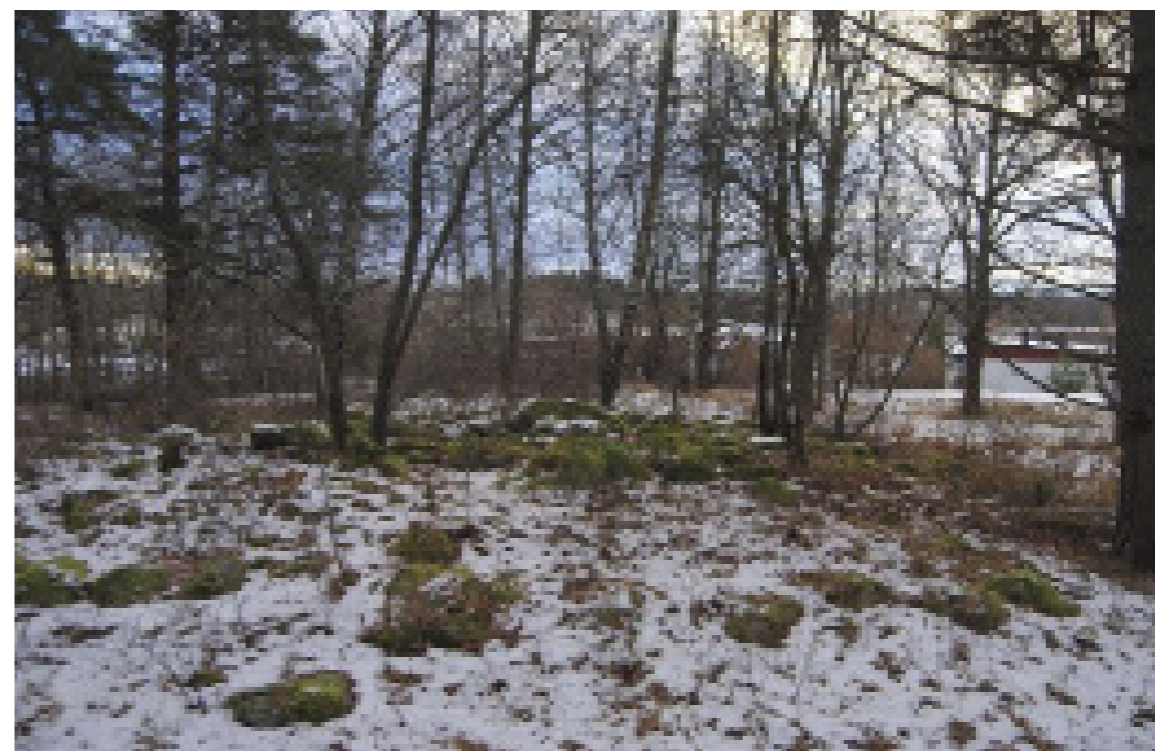
Hallundaboplatsen (Botkyrka 69:1) med gravar, boplots-, handels- och bronsgjuterilämningar ligger på en höjd mellan Hallunda gård och Mälaren.