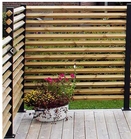
Plank med luft mellan brädorna

Staketet får inte vara klättringsbart. Därför föreslår bygglövsenheten nedanstående utformningar på staket.