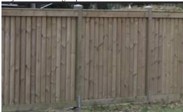
Plank utan luft mellan brädorna