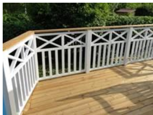
Insida på staket