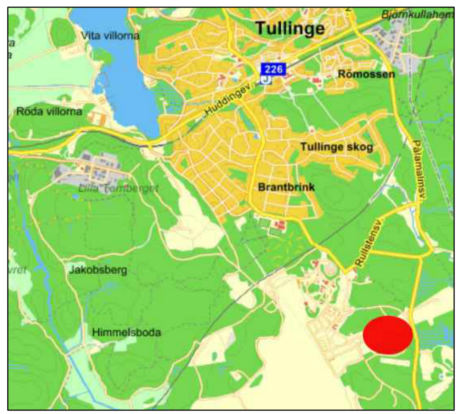
ORIENTERINGSKARTA ÖVER PLANOMRÅDET