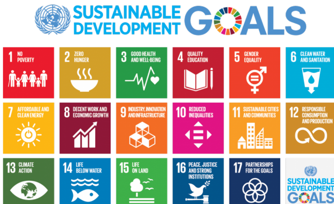
Figur 1. FN:s globala hållbarhetsmål.

den kommunala nämnden. Vad som faller under miljö- och hälsoskyddsnämndens tillsynsansvar är också reglerat i reglementet för miljö- och hälsoskyddsnämndens verksamhet.