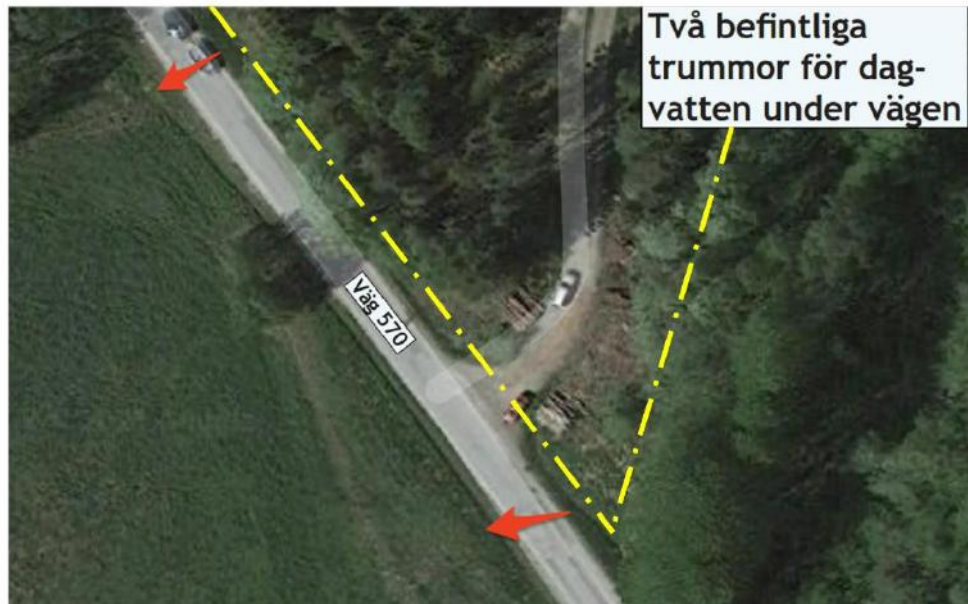
Figur 1. Pilar visar ungefärligt läge för lågpunkter och befintliga dagvattentrummor. Ungefärlig sydlig och sydostlig planområdesgräns visas i gult.

Huruvida de befintliga trummorna ägs och driftas av Trafikverket är oklart; ifall så är fallet kommer en ny trumma att behöva anläggas för bortledning av dagvatten från planområdet. Eftersom marken söder om planområdet har samma ägare/bostadsutvecklare kommer en lösning med öppet dike från "planområdets trumma" kunna åstadkommas. Det nya öppna diket föreslås ansluta till Snäckstaviksbäcken som mynnar i Snäckviken, Kaggjärden. För att undvika större ingrepp i ängsmarken föreslås befintliga diken i ängsmarken nyttjas. Trafikverkets dike på södra sidan väg 570 kommer därmed inte att påverkas eller få sämre funktion.