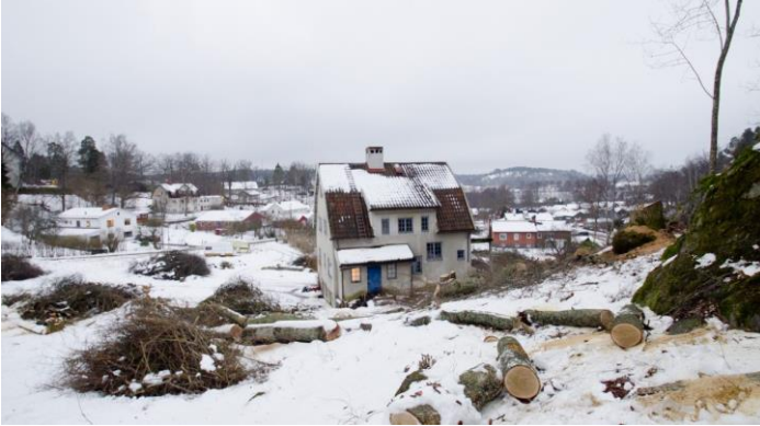
Äldre foto från Nordanvägen i Tullinge. Notera att hundraåriga ekar och gamla äppleträd tagits bort.

Tyvär har majoritetens ovilja att uppdatera detaljplaner i Tullinge medfört att hela kvarter har förändrats. Vid exempelvis Nordanvägen i Tullinge har man byggt bort parkliknande natur med hundraåriga ekar och gamla äppleträd till förmån för malplacerade bostäder.