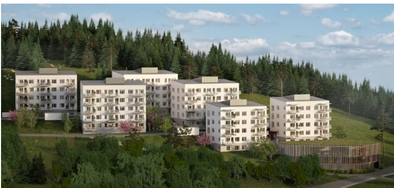
Tidigare föreslagna bostäder vid Ringblomman.