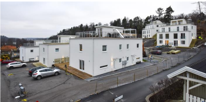
Nyare foto från Nordanvägen med de 28 nya bostäderna som liknar en "grekisk semesterby". Här fanns det tidigare ett gammalt hus från början av förra seklet.

Få träd sparas för en maximering av boytan. På så sätt förstör man karaktären i villaområden samt skapar missämja hos de som drabbas. Och klippning av de kommunala vägrenarna har i många fall skett med s.k. slaghacka, vilket står i ren motsats till biologisk mångfald. Allt detta rimmar illa med den höga svansföring som Botkyrka ofta har i miljöfrågor.