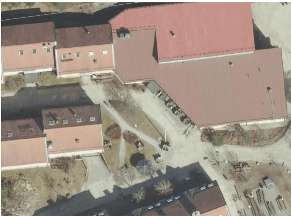
Bild över område 5.