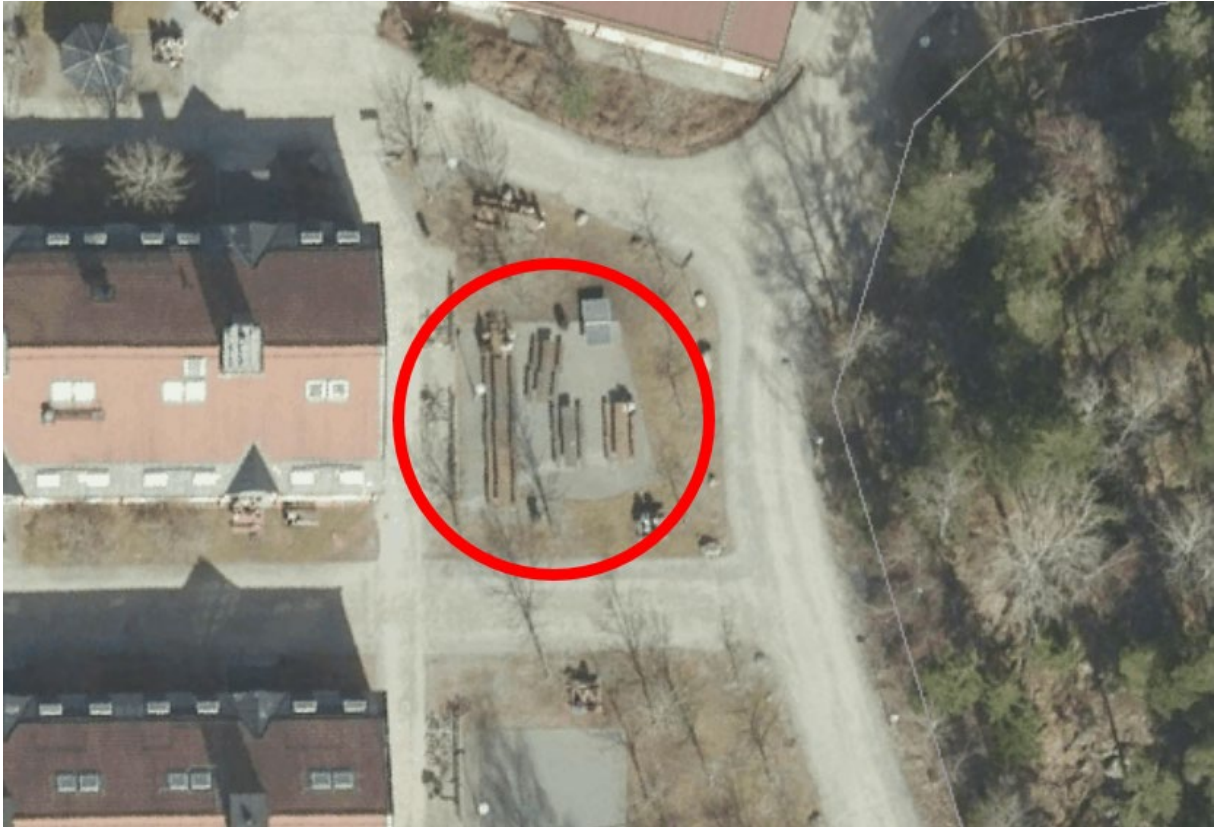
Bild över område 2.

Område 2 med röd markering i bilden nedan pekas i barndialogen ut som en viktig yta att bevara och utveckla. Område 2 nyttjas idag till stor del som uppehållsyta att äta lunch på under årets soligare dagar, samt för annat umgänge och aktiviteter som utebio. Platsen är ofta fullsatt under de varmare delarna av året men behovet av ytterligare sittplatser och skydd mot vind noterades. Eleverna föreslog även att parkeringsmöjligheter bör övervägas nära dessa sittplatser.