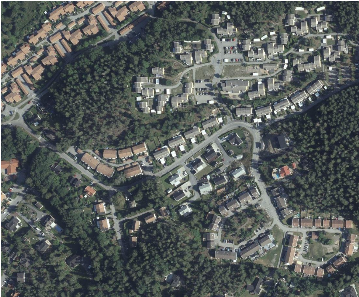
Områdets befintliga utformning. Ortofoto från Lantmäteriets visningstjänst.

Träden presenteras på en ritning samt i ett fotodokument.